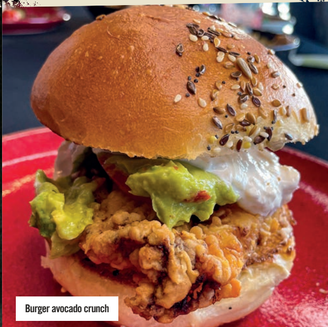
Burger avocado crunch

WRAP POULET SAUCE CÉSAR NOUVEAU ..... 12,90€