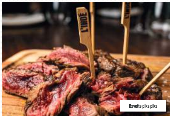
Bavette pika pika